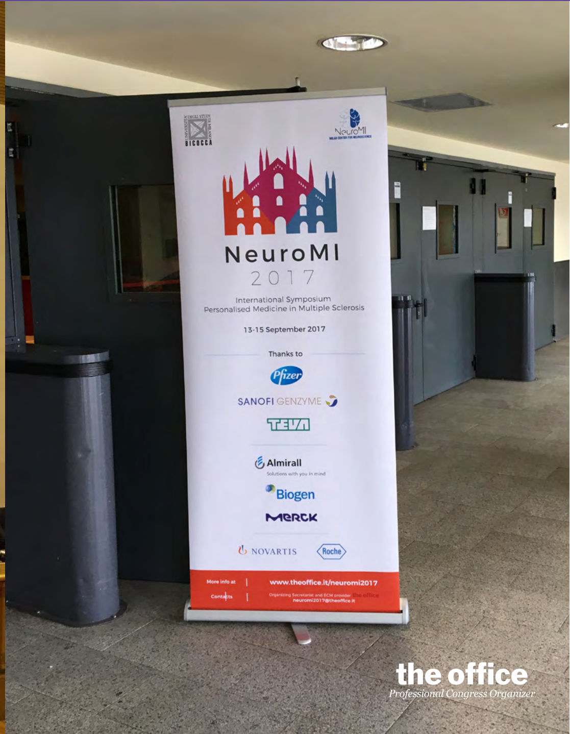
Banner web e segnaletica esterna (rollup)